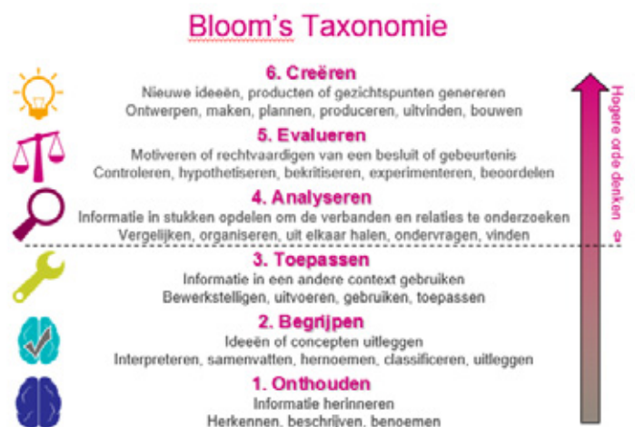
Afb. 3. Taxonomie van Bloom

Tijdens onderzoekend of ontwerpnd leren kun je een beroep doen op de hogere orde denkvaardigheden van leerlingen door vragen te stellen die zich richten op het stimuleren van kritisch denken, probleemoplossingsvermogen, zelfstandigheid en het ontlocken van discussie. Lagere orde vragen zijn vragen die een beroep doen op onthouden, begrijpen en toepassen, bijvoorbeeld wanneer je als leerkracht wilt evalueren in hoeverre een leerling iets begrijpt. Dit onderscheid tussen lagere en hogere orde vragen is gebaseerd op de 'Taxonomie van Bloom'. Bloom heeft een taxonomie ontwikkeld met zes niveaus, oplopend in moeilijkheidsgraad: onthouden, begrijpen, toepassen, analyseren, evalueren en creëren (zie afbeelding 3).