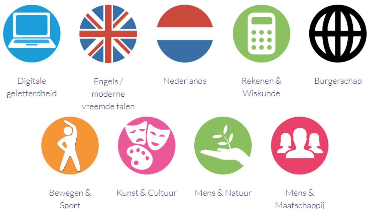
Figuur 1. Leergebieden binnen Curriculum.nu

De verkenning is primair bedoeld voor de leraren die gaan deelnemen aan de ontwikkelteams voor de verschillende leergebieden. Figuur 1 toont de leergebieden zoals deze worden gehanteerd binnen Curriculum.nu. Deze verkenning heeft tot doel deze leraren te inspireren en adviseren als het gaat om doelen voor techniek- en technologieonderwijs. Het biedt handvatten en aanknopingspunten om de verschillende ontwikkelteams zicht te geven op de diverse mogelijkheden die techniek en technologie kunnen bieden. De verkenning is nadrukkelijk bedoeld voor alle ontwikkelteams. De verdere borging van de opbrengsten van deze verkenning vindt dan ook idealiter plaats binnen alle ontwikkelteams. We geven in dit stuk geen afbakening of domeinbeschrijving van techniek en technologie. Dat zal gebeuren in de volgende fase waarin de ontwikkelteams aan de slag gaan.